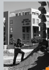
Maison de quartier « l'EsKale » (façades nord et sud) Rue Louis Pergault (Kesler Devillers)