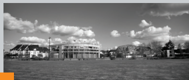
Ferme de Kerfréhour (sous le hangar) 20 rue de Kerfréhour