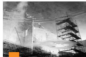
Galerie La Rotonde

Hôtel de Ville de Lanester & Galerie La Rotonde Du lundi au vendredi de 8h30 à 12h et de 13h30 à 17h sauf le jeudi de 10h à 12h et de 13h30 à 18h30 Le samedi de 9h à 11h45