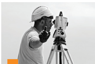
Hall de l'Hôtel de Ville de Lanester

« Les ouvriers en action sur le chantier, telle une mise en scène : mouvements du corps, des mains, du regard ; mais aussi mise en lumière du travail d'équipe, de l'écoute, du respect mutuel... »