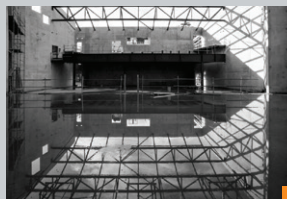
Maison de quartier « Ti Penher »

(façades nord et sud) 27 rue Jules Ferry